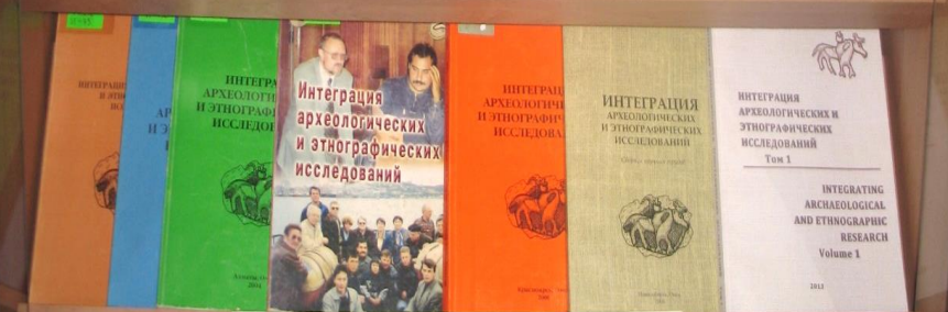
СБОРНИКИ НАУЧНЫХ ТРУДОВ